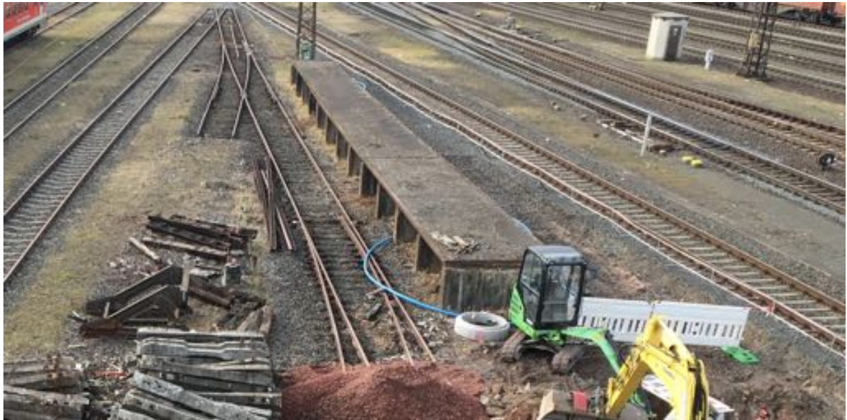
Foto vom Dämmer Steg aus Richtung Westen - der letzte Rest der Laderampe die bis zum Güterbahnhof gereicht hat. Das linke Gleis hat vor dem Güterbahnhof geendet, das jetzt nicht mehr existente Gleis rechts dieser Rampe ging bis zum Güterbahnhof.